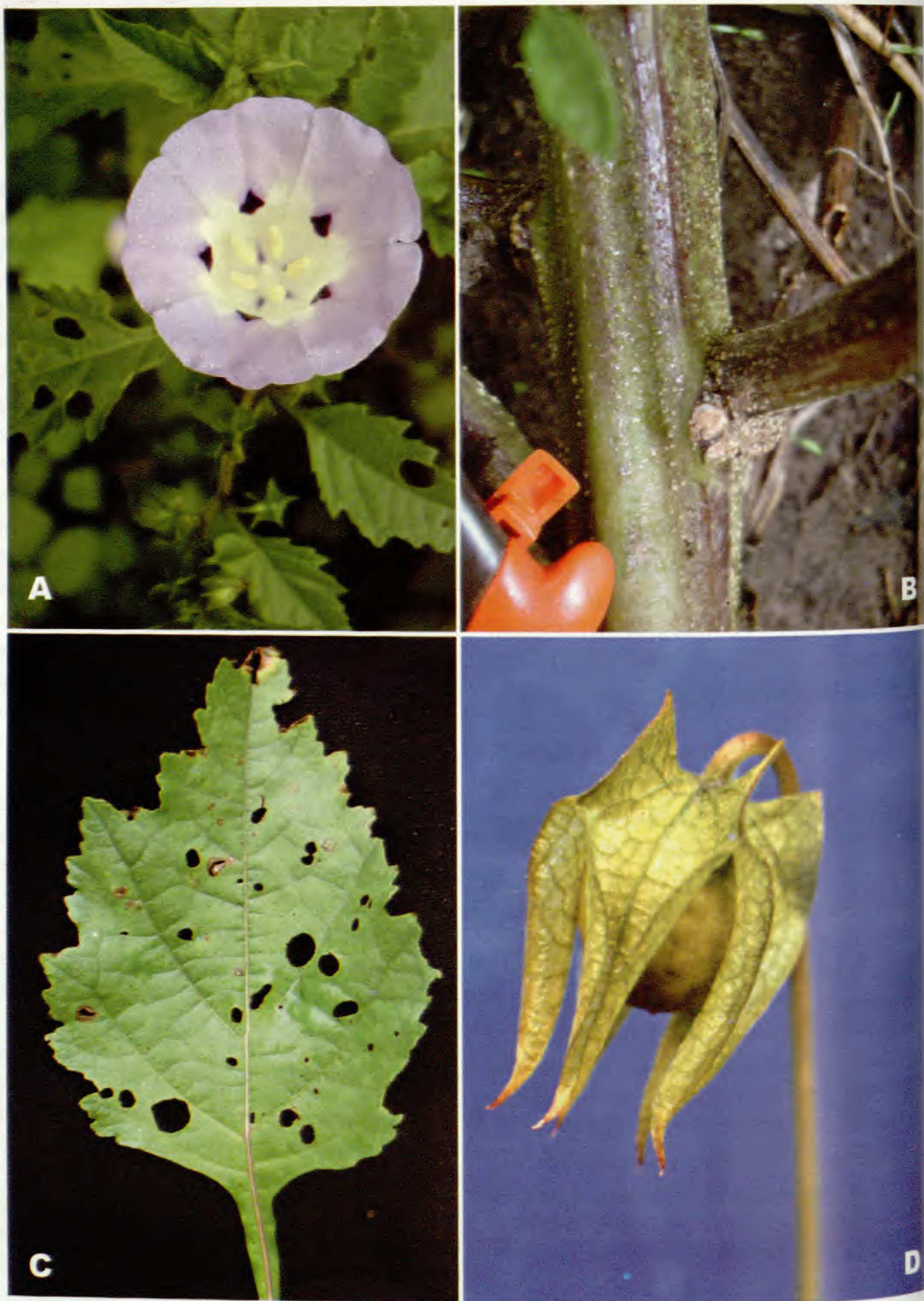
Fig. 2. Nicandra john-tyleriana S. Leiva & Pereyra. A. Rama florífera; B. Tallo; C. Hoja y D. Fruto. (S. Leiva & Pereyra 3671, HAO).